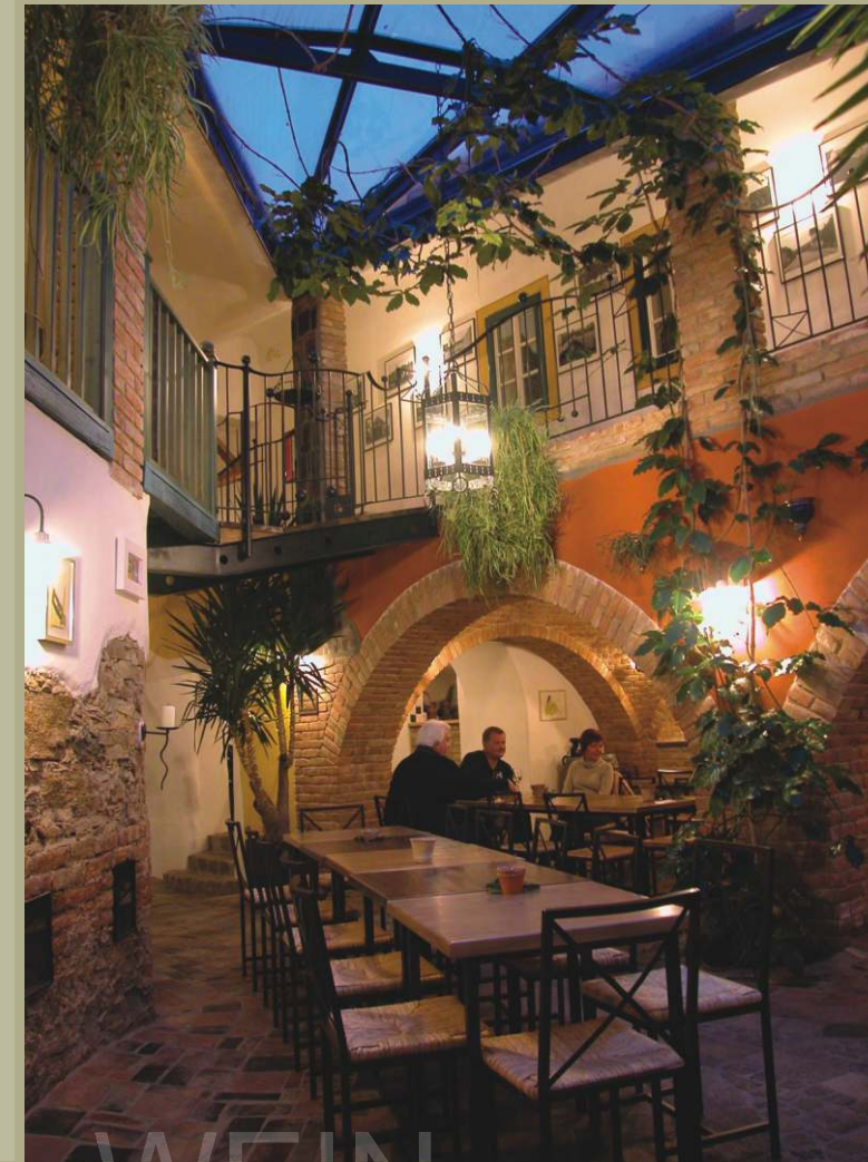
Für den Inhalt verantwortlich: Verein Alte Schmiede | Grafik: Savio | Text: Reiner Tiefenbacher | Fotos: Alte Schmiede, Savio